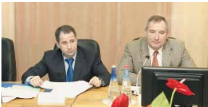
Михаил Бабич и заместитель Председателя Правительства РФ Дмитрий Rogozin

Михаил Бабич назвал уровень социально-экономического развития республики достаточно стабильным.