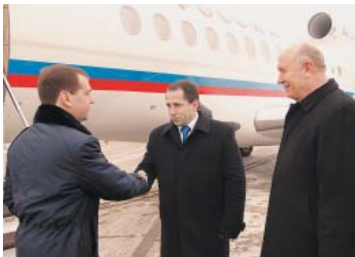
На фото слева направо: Президент РФ Дмитрий Медведев, Михаил Бабич, Глава РМ Николай Меркушкин

Полпред Президента России рассказал о перспективах развития научного и оборонно-промышленного комплекса Приволжья. Также он провел оперативное совещание по системе контроля за тарифами в сфере ЖКХ, естественных монополий, ценам на горюче-смазочные материалы и лекарственные препараты. В нем приняла участие губернатор Пермского края Олег Чиркунов, главный федераль-